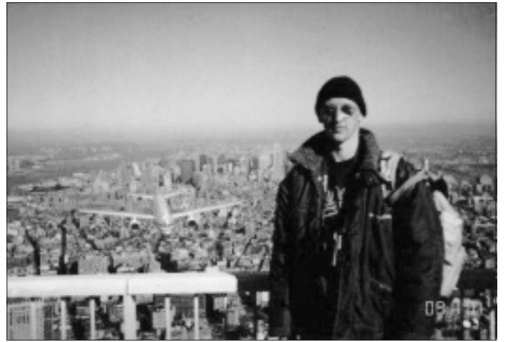
Нью-Йорк (11.09), Всемирный торговый центр. За мгновение до...

Администрация Буша уже собирает международную коалицию для войны в израильском стиле против «терроризма», как будто такой непродуктивный произвол может привести к результатам, независимо от социальных условий, из которых они возникают. Но за каждой уничтоженной «сетью террора» появится другая... И это может продолжаться до тех пор, пока не будет уничтожен источник несправедливости и неравенства.